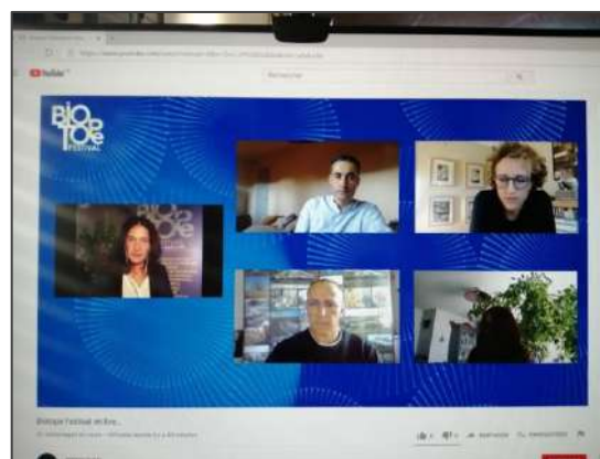
Captures d'écran de l'événement en ligne