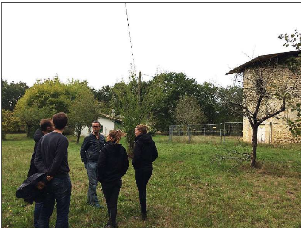
Présentation du domaine de Peyssoup, futur écolieu par l'association Eh'Co

Au 31 décembre 2020, la Fédération Médoc Initiatives c'est :