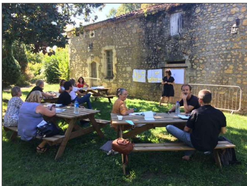
Ateliers de réflexion au domaine de Nodris – septembre 2020

La démarche a mobilisé les acteurs pendant plus de 6 mois, à raison de 1 à 2 matinées par mois.